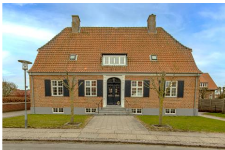
Domprovstegården i Albert Skeels Gade, tegnet af Lønborg Jensen, er typisk for stilen

Mange af de mere markante nyere huse og bygninger i Ribe opført efter 1915 er et resultat af stiftelsen af "Landsforeningen til fremme af bedre Byggeskik på Landet". Foreningen blev stiftet af en gruppe danske arkitekter og tog udgangspunkt i ældre dansk byggeskik og overlappede nyklassicismen. Foreningen virkede fra 1915-1965. Dens arkitekter ønskede at tegne enkle huse, bygget med simple materialer og af lokale håndværkere. Deres huse kaldes derfor også for "murmestervillaer".