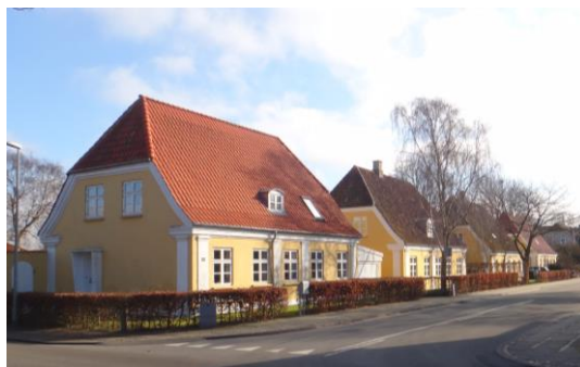
Fire villaer på Valdemar Sejrs Alle