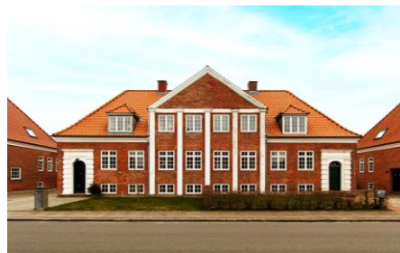
De seks dobbelthuse i Kongensgade er fra 1920

De mest markante bygninger er dog de 6 dobbelthuse i Kongensgade. En gruppe jævne ripensere gik sammen og oprettede "Byggeforeningen af 1920". Her fik blandt andre ansatte ved jernbanen en bolig med adgang til moderne faciliteter som centralvarme, varmt vand i hanerne, elektricitet og vandskylende toiletter. På den tid for de fleste en ukendt luksus.