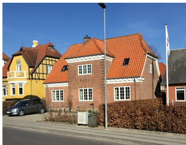
Villa "Cama" på Tangevej 15

Fortalt af Ribe Kirkegårdes Fortællegruppe