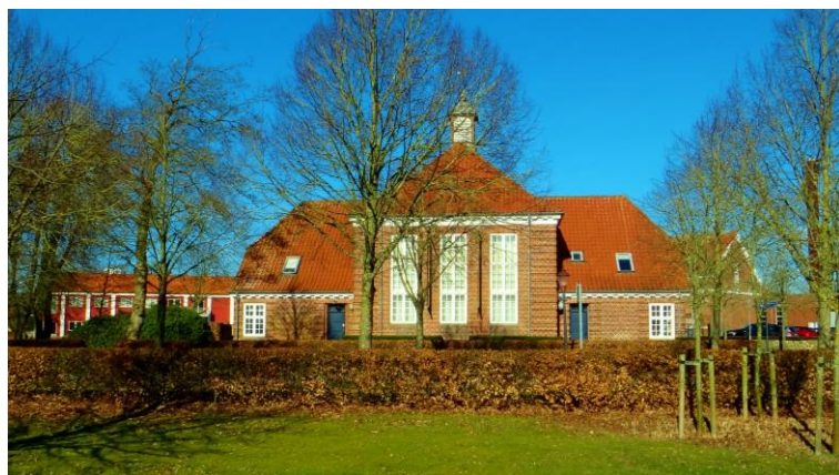
Tidligere el-værk – nu "Museet Ribes Vikinger"