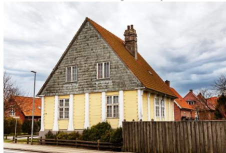
Sct Jørgensgade 11

Gade 1, Ribe Stifts Tidendes bygning langs Vægtergade, restaureringen af det tidligere sprøjtehus på Torvet, elektricitetsværket i Dagmargade (nu museet "Ribes Vikinger" ved Banegården, villaen Sct. Jørgensvej 11 o. m. a.